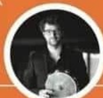
гост ЖАН-БАТИСТ ЛЬОКЛЕР ФРАНЦИЯ